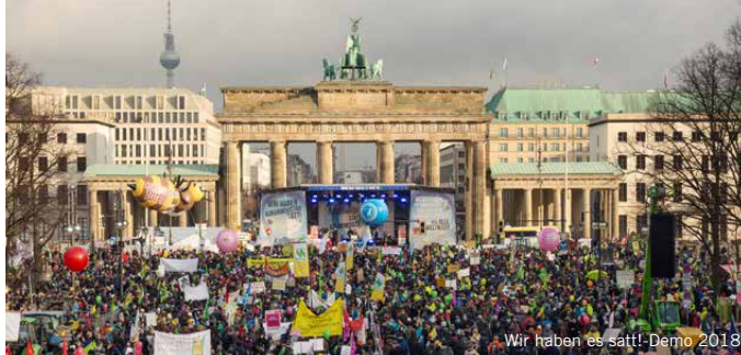
V.L.S.D.P. SASKIA RICHARTZ, MEINE LANDWIRTSCHAFT, MARIENSTR. 19-20, 10117 BERLIN GESTALTUNG: SICHTRAGIGATION

Wir sind Bäuerinnen und Bauern, von konventionell bis bio, von Tierhaltung bis Ackerbau. Wir sind Bäcker*innen, Köch*innen, Imker*innen, Aktive der Entwicklungszusammenarbeit, Natur-, Umwelt- und Tierschützer*innen und viele mehr. Alt und jung, Stadt und Land – seit 2011 zeigen wir klare Kante für gute Landwirtschaft und gesundes Essen!